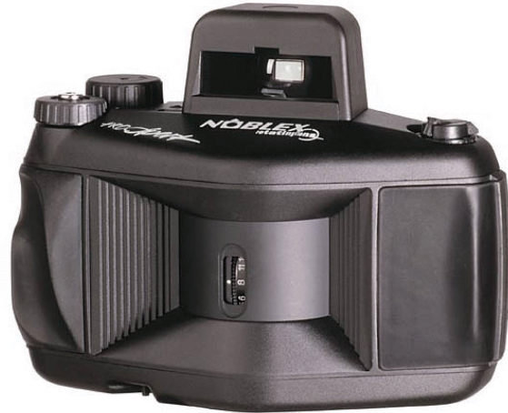
Noblex 135 Sport

Vid exponering vrider sig objektivet mellan ytterlägena. Nu kan man inte använda normal centralslutare eftersom filmen exponeras gradvis enligt objektivets läge. En spalt öppnas framför filmen, bredden bestämmer exponeringstid, och spalten sveper över filmfönstret (fungerar som en ridåslutare i vanlig systemkamera). Filmhållaren måste vara rundad så att samma avstånd hela tiden hålls till filmplanet (i annat fall skulle skärpan försvinna). Eftersom det tar en viss tid att exponera filmrutan kan fenomenen uppträda. Om man har ett rörligt objekt blir det avbildat, beroende på rörelseriktning och hastighet, som utdraget eller komprimerat.